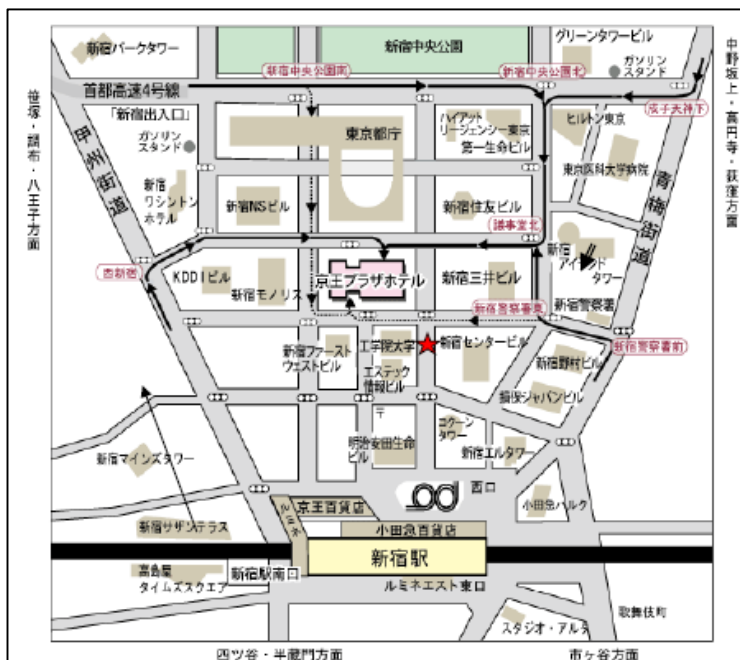
図1. 集合場所（JR 新宿西口 工学院大学付近）