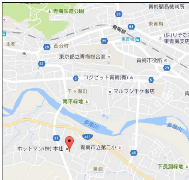
図3. ホットマン株式会社 青梅工場